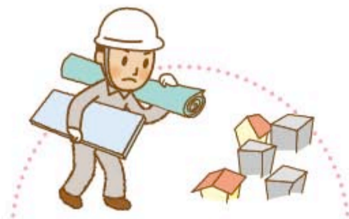
災害救援ボランティア

障害のあるなしにかかわらず、おもちゃを通 して知り合い、共に育ちあう活動です。子育て について親や家族が学びあう場でもありま す。