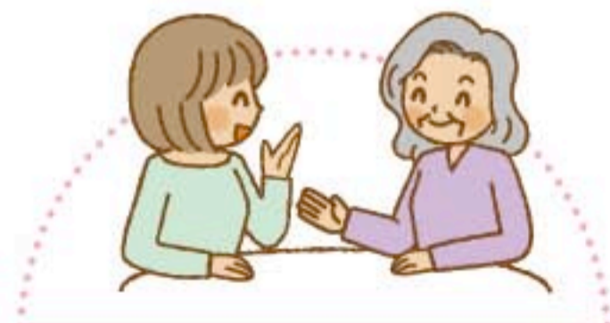
地域での助け合い活動

災害地でさまざまな支援活動を行います。 危険がともなう場合もありますので慎重に。