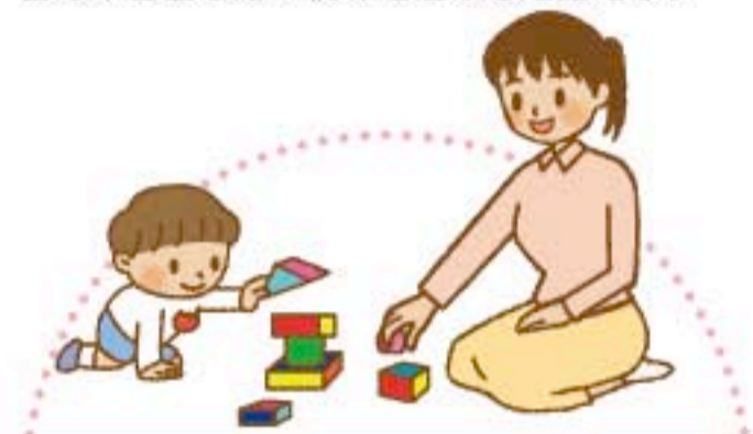
おもちゃ図書館活動

職員と協力しながら、施設の中でお話し相手 やレクリエーションのお手伝いをします。