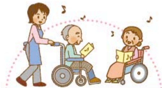
施設ボランティア

職員と協力しながら、施設の中でお話し相手 やレクリエーションのお手伝いをします。