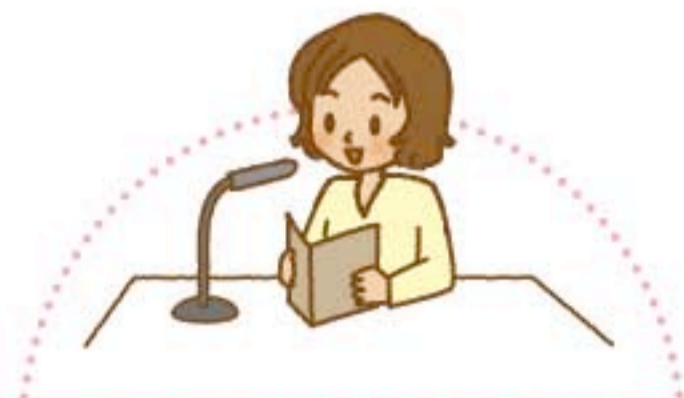
点訳・朗読ボランティア