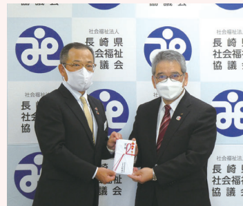
住友生命保険相互会社長崎支社 様