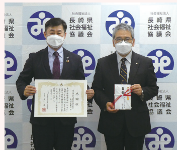
東洋羽毛九州販売株式会社 様