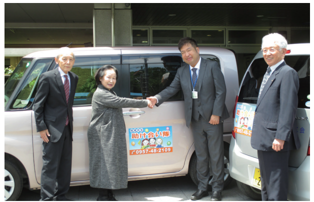
▲デイサービス車両提供式

施設と、「地域共生助け合い隊」とで、活動状況や飯盛町内の高齢者が抱える外出問題等について情